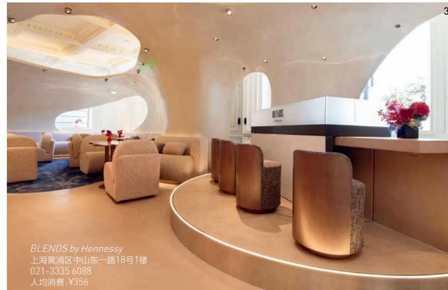
BLENDS by Hennessy 上海黄浦区中山东一路18号1楼 021-3335 6088 人均消费：¥356