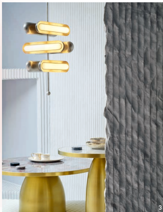
Drinks & Co 上海黄浦区 太仓路181弄16号 15601671458 人均消费：¥195 空间设计 Linehouse www.linehousedesign.com